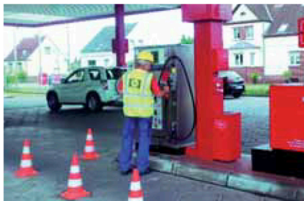
Als Fachfirma für die technische Betreuung und Spezialist für Reparaturen an Autogasfüllanlagen hat sich Schröder Gas in Nord-, Mittel- und Ostdeutschland einen Namen gemacht.

Das Familienunternehmen Schröder Gas ist der überregionale Energieversorger und Servicedienstleister für Haushalt und Gewerbe. Neben der Installation und Wartung von Flüssiggasanlagen im Haushaltsbereich bietet Schröder Gas auch Dienstleistungen im Bereich von gewerblichen und industriellen Flüssiggasanlagen an, sowie Wartung und Prüfungs koordinierung von Autogastankstellen und Flüssiggasfüllanlagen.